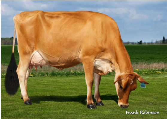
JX VIERRA PRESLEY {6} THIRD DAM